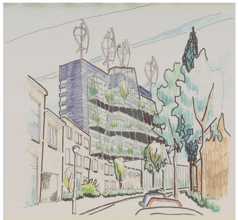
Afbeelding 2: Een schets van een hergebruikt kantoorgebouw in de binnenstad. Een aangebouwde broeikas kan met technieken uit de glastuinbouw worden gekoeld, waardoor 's zomers energie kan worden opgeslagen waarmee de woningen 's winters worden verwarmd. Er kunnen gemeenschappelijke 'hangende tuinen' worden toegevoegd.

Het is al met al een bijzonder initiatief. Niet alleen in de manier waarop bewoners vrij